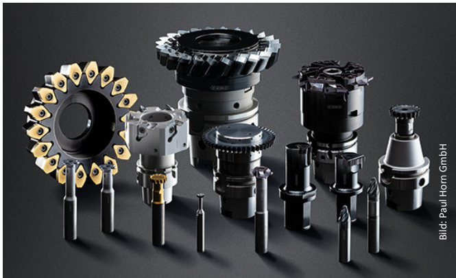
Erweitertes Werkzeugportfolio zur wirtschaftlichen Herstellung von Verzahnungen

Aufgrund des Best-Practice-Ansatzes der Softwarelösung wurde die Einführung von CLARC INVOICE FOR SAP innerhalb des geplanten Zeitrahmens umgesetzt. Dass die Projektleitung die geplante Timeline eingehalten hat, kam bei den Verantwortlichen von Paul Horn sehr gut an. Mittels der Standard-Schnittstellen der Lösung ist diese nun vollintegriert im SAP-System der Paul Horn GmbH und bildet dabei sämtliche buchhalterischen Workflows ab. Aus komplexen Freigabeprozessen für die Mitarbeiter wurde dadurch ein digitaler Rechnungsfreigabeprozess, der im Dialog mit der Fachabteilung oder bei komplett fehlerfreien Rechnungen und innerhalb definierter Grenzen automatisch verbucht wird.